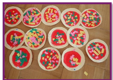
おいしいピザが やけました